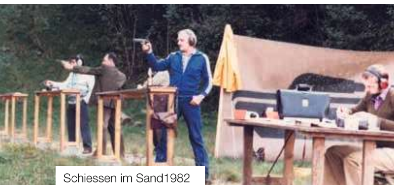
Schiessen im Sand 1982

Am 6. Oktober 1945 wurden die Pistolen- und Revolverschützen nach dem Aktivdienst von 10 pistolen- oder revolvertragenden Wehrmännern im Landgasthof Schönbühl gegründet. Am 6. September 2025 wurde das 80-jährige Jubiläum gefeiert – nun mit 81 Vereinsmitgliedern.